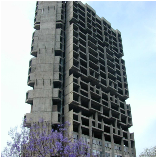
Figura 2. Vista general del Edificio Torre VESINM en el año 2005

El Núcleo de Circulación vertical se ubica en el extremo Norte de la Torre y contiene la batería de ascensores, la escalera de servicios y un cuarto para materiales de limpieza y conducto para compactador. La estructura del núcleo de servicios está resuelta con un gran tabique en U rodeando la caja de ascensores y otros tabiques menores con vigas de acoplamiento configurando una planta triangular que se repite en toda la altura de la estructura, ubicándose en su parte superior el tanque de agua y la sala de máquinas. En el piso trece existe otro tanque de agua intermedio de hormigón armado.